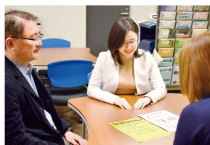
インキュベートマネージャーに経営相談をする様子

同じ施設内に、八尾商工会議所、日本政策金融公庫東大阪支店国民生活事業八尾出張所、八尾市産業政策課、八尾市立中小企業サポートセンターが入居していますので、経営相談、融資相談、技術支援等、それぞれの強みを生かした幅広い支援をご利用いただけます。