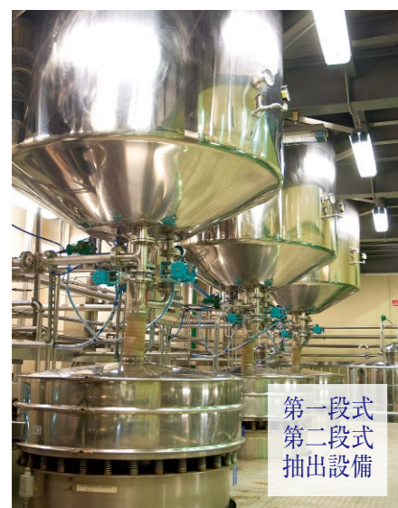
第一段式 第二段式 抽出設備