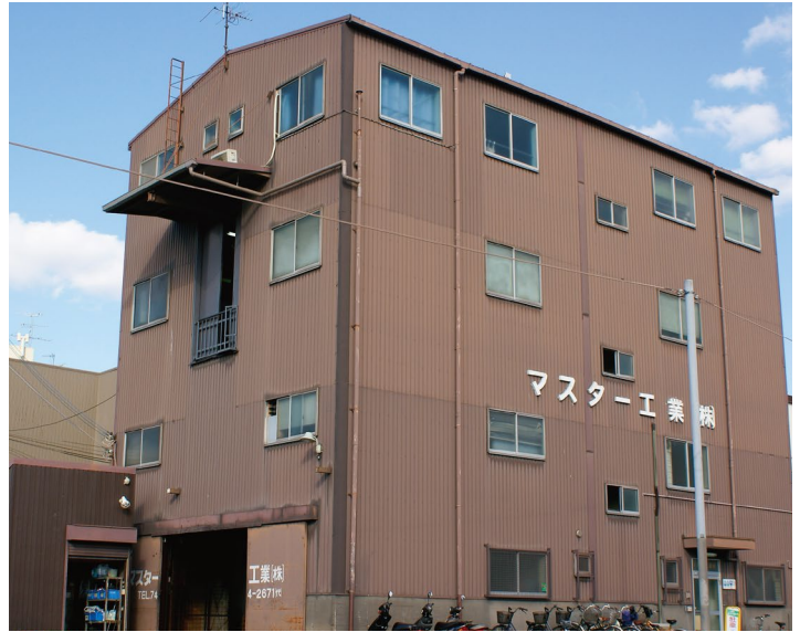
マスター工業本社(東大阪)