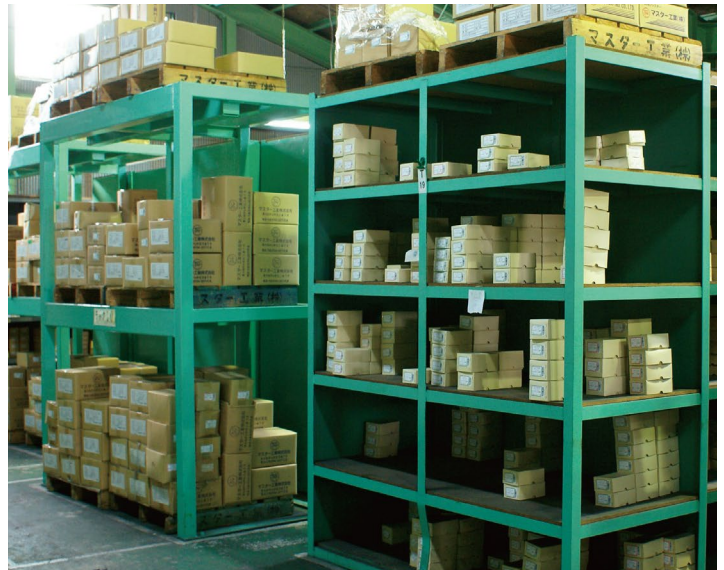
東大阪ストックヤード