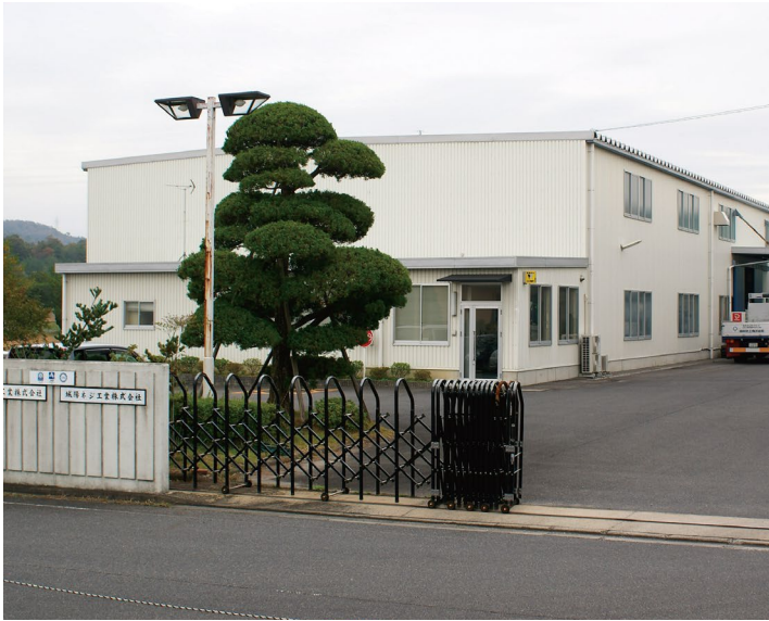
マスター工業(伊賀工場)