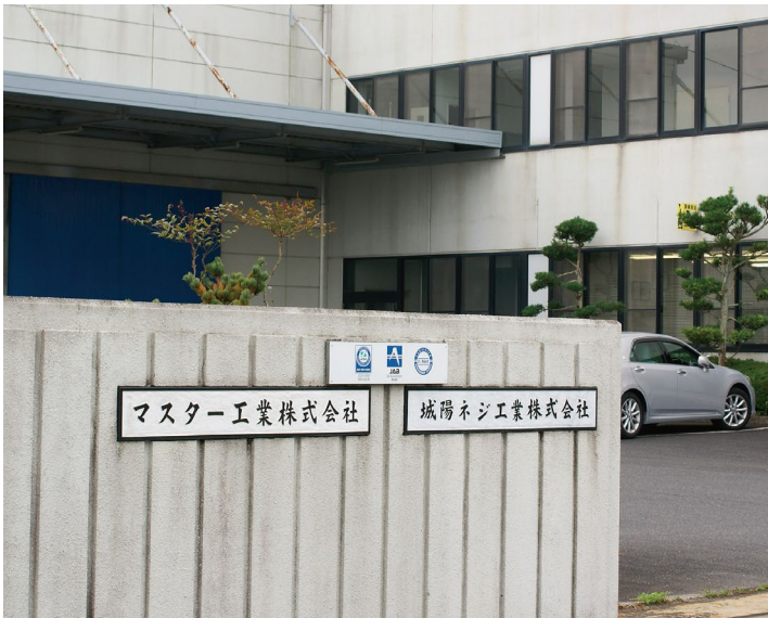
マスター工業(株)伊賀工場