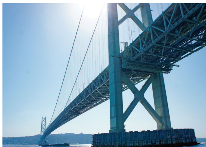
明石海峡大橋にもミハナ製作所の安全弁が取り付けられています

モノ作りが大好きな君の情熱を、ミハナ製作所で思う存分発揮して世の中に役立ててください。