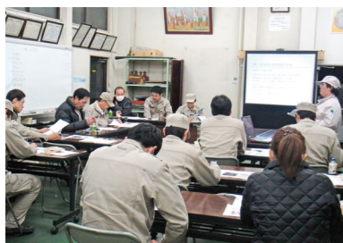
改善・提案活動発表会