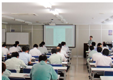
国内・海外セミナー

を行い向上心を評価しています。その他27年も続いているポスター競技会、海外への社員旅行や親睦バーベキューなどのレクリエーション活動も実施し小規模の企業ならではのアットホームな社風もミハナの魅力のひとつです。