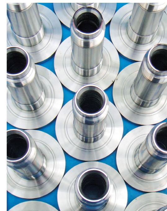
ラッピング技術で、オングストロームの領域まで研磨された安全弁要部部品。

この素晴らしいミハナ製作所の実績を刺激に、君も人々の安全のために業務に取り組んでください。