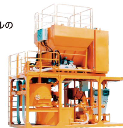
モルタルプラントの修理及びメンテナンス