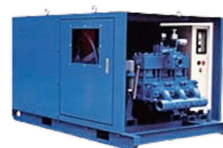
グラウトポンプの修理及びメンテナンス