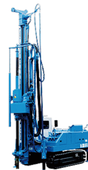
地盤改良機の修理及びメンテナンス

上記製品以外でも修理・点検並びに出張修理サービス・中古機械の売買・ 部品の販売・製作・加工等を行います。 対応地域:全国各地