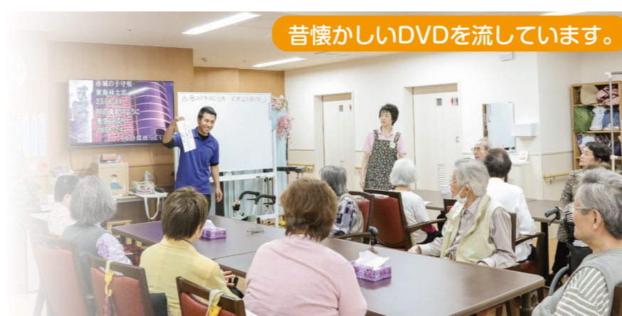
昔懐かしいDVDを流しています。