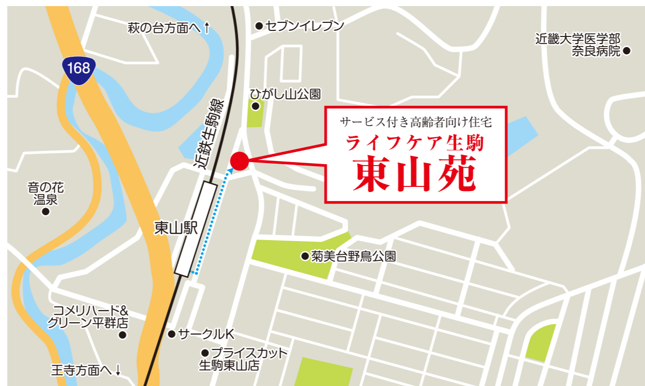
近鉄生駒線「東山駅」より徒歩2分