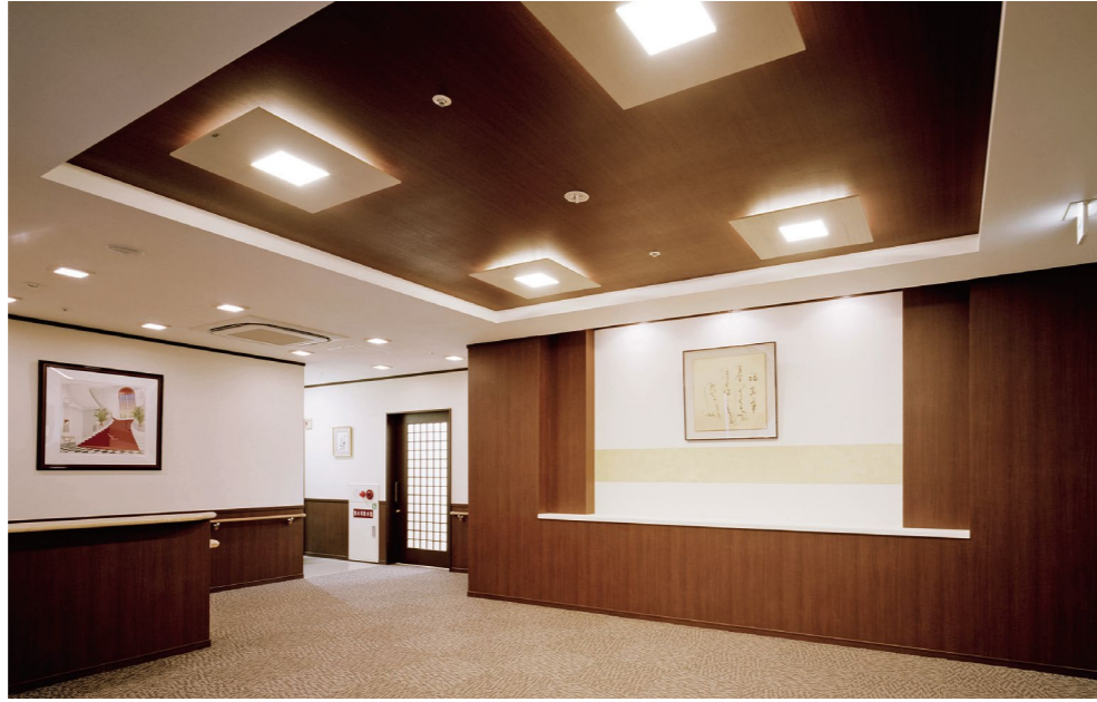
エントランス 和風のデザインが落ち着きを演出するエントランスで上質の空間をご提供します。

万葉集や古事記でも見られる言葉で、すぐれた良い場所・よい国(風土)といった意味があります。 “まほろば”では、入居者様に心地良く暮らしていただきたいという気持ちが込められています。 最良の場所で、ご自身が「自分の人生を尊び、内面的な豊かさを追求しつつ、人との和を大切に、暖かな雰囲気の中、趣味を楽しむ～このようなくつろぎのある時間を過ごしていただきたい」と考えております。それが、私たちグッドタイムの理念です。