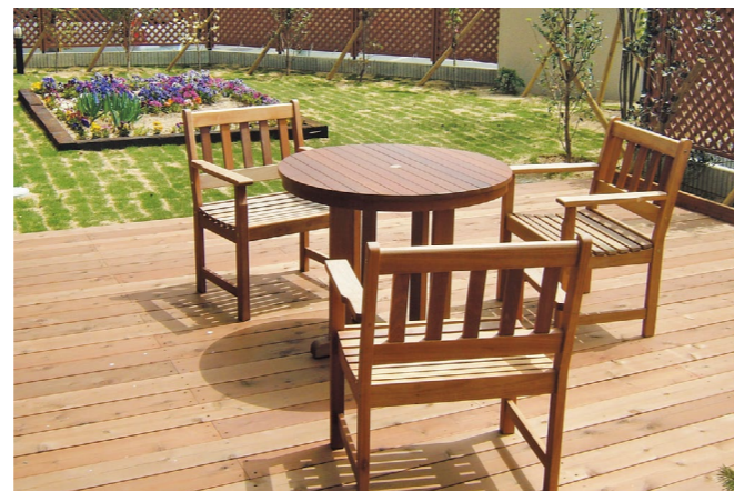
ウッドテラス 太陽の光につつまれて

ホーム南面にあるウッドテラスは、陽射しが燦々と降り注ぎ、開放感にあふれ入居者様、家族様に憩いのひと時を提供いたします。また、その隣にはかわいい菜園を設け、四季折々の花作り、野菜作りを楽しんでいただけます。